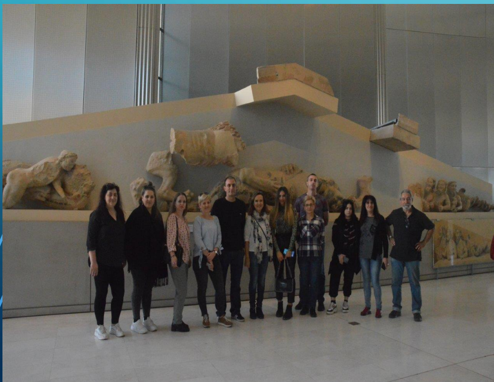
МУЗЕЙ НА АКРОПОЛА